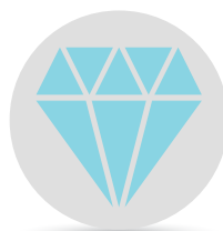
COMERCIALIZACIÓN/TALLADO/ PULIDO DE DIAMANTES