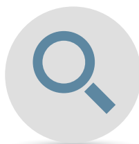
INDUSTRIAS DEL SECTOR SERVICIOS